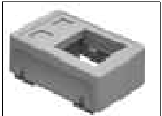
Detalhe 02: Porta Equipamento Para Bloco de Tomada Elétrica e Tomada RJ 45.