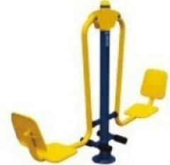
Pressão de Pernas