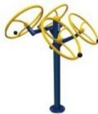
Rotação Dupla Diagonal