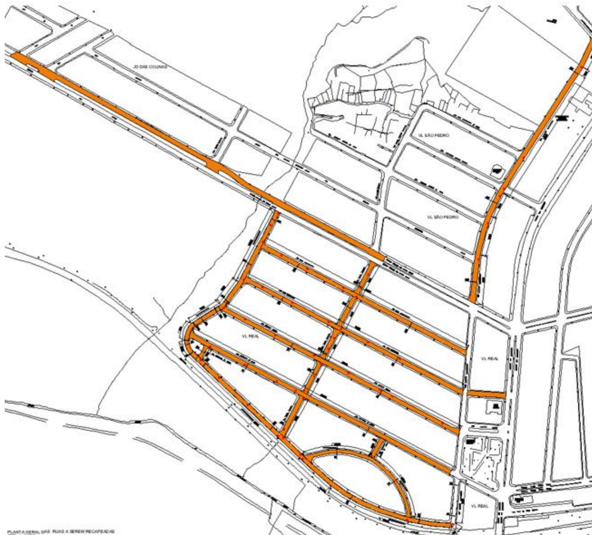
Imagem – Ruas a serem recapeadas, Ruas dos bairros Vila Real e Vila São Pedro.