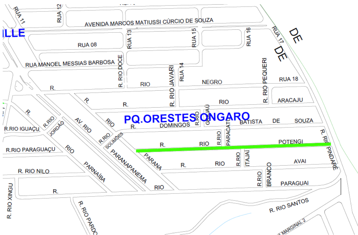
Imagem – Rua a ser recapeada, Rua Rio Potengi, Parque Orestes Ôngaro.

A FISCALIZAÇÃO se encontra no direito de aprovar ou vetar a execução de uma obra, ou parte dela, principalmente em se tratando de uma obra pública, cujo usuário será o próprio povo. A FISCALIZAÇÃO realizará vistorias no local da obra conforme croquis abaixo: